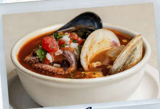
Caldo 7 mares

EN CASO DE SER ALÉRGICO A ALGUNO DE NUESTROS INGREDIENTES, AVISE AL MESERO.