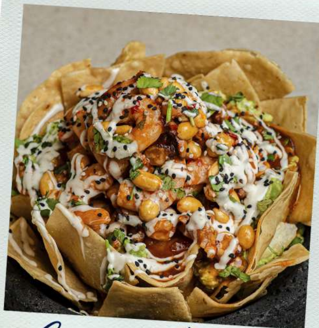
Guacamole de mariscos

200 g de queso gouda fundido con vino blanco, acompañado de 50g de chistorra asada o camarón a la plancha. Por $70 más, hazlo mixto.