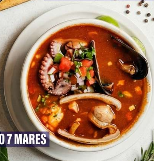
CALDO 7 MARES