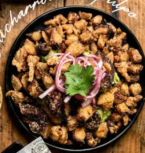
Chicharrón de pulpa