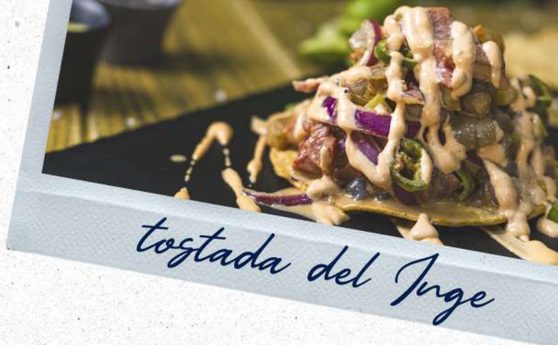
tostada del Inge