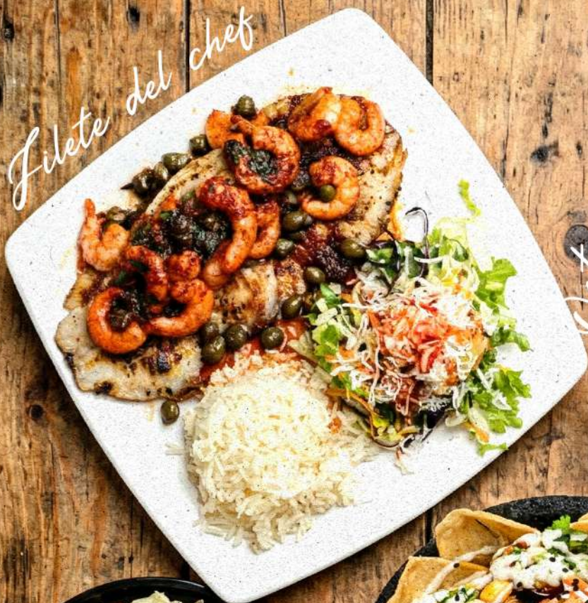
Filete del chef